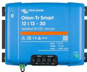
Orion-Tr Smart 12/12-30