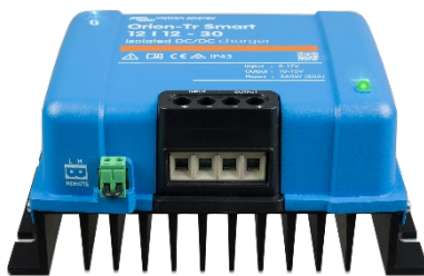
Orion-Tr Smart 12/12-30