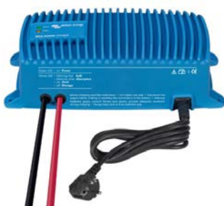
Blue Smart IP67 acculader 12/25