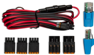
Accessoires inbegrepen bij de Cerbo GX

De Cerbo GX is eenvoudig te monteren en kan ook op een DIN-rail worden gemonteerd met behulp van de DIN35 adapter small, (niet inbegrepen). Het aparte touchscreen kan op een dashboard worden vastgeschroefd, zodat u geen preciese uitsparingen hoeft aan te brengen (zoals met de Color Control GX). Het is eenvoudig te verbinden via één enkele kabel, waardoor het gedoe van met een hoop kabels naar het dashboard wordt weggenomen. De Bluetooth-functie maakt een snelle verbinding en configuratie mogelijk via onze VictronConnect-app.