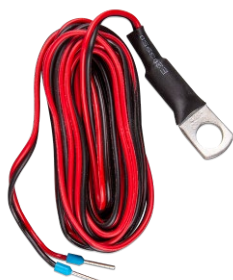
Temperatuursensor voor de Quattro, MultiPlus en GX-apparaten (zoals de Cerbo GX)

Deze adapter is ontworpen om het CCGX-beeldscherm eenvoudig te vervangen door de nieuwere GX Touch 50 of de GX Touch 70. De inhoud van de verpakking bestaat uit de metalen beugel, de plastic vak en vier bevestigingsschroeven.