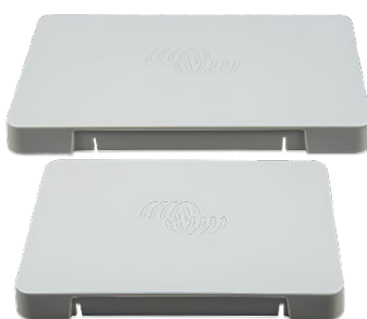
GX Touch 50 & 70 beschermende kunststof kap