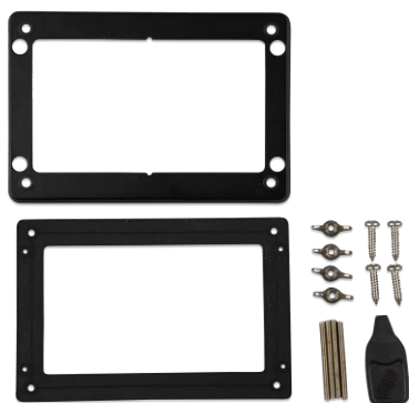
Accessoires inbegrepen bij de GX Touch